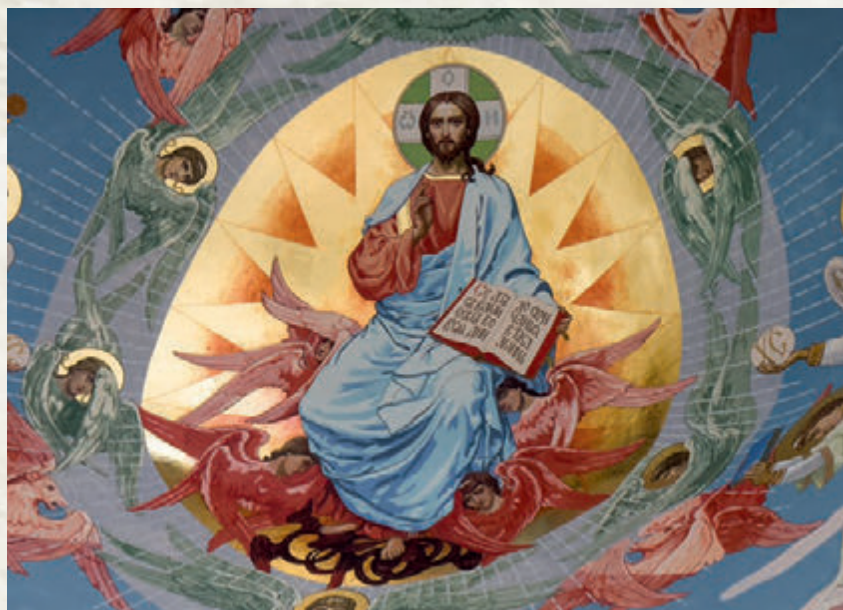
РОСПИСЬ «СПАС В СИЛАХ»