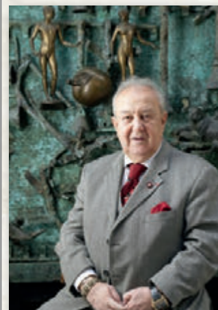
ЦЕРЕТЕЛИ ЗУРАБ КОНСТАНТИНОВИЧ

It seems to me necessary to involve children's fine arts that have been perceived for a long time as the most important phenomenon of the modern society's cultural life into the orbit of Christian art. Undoubtedly, the "Christian Art" catalog could be useful not only to art fanciers in general, but also to teachers and art educators working with artistically talented children helping them to expand their cultural horizons and the spiritual orientation of creativity. The catalog could be used as a guide for the art education process striving for innovative development.