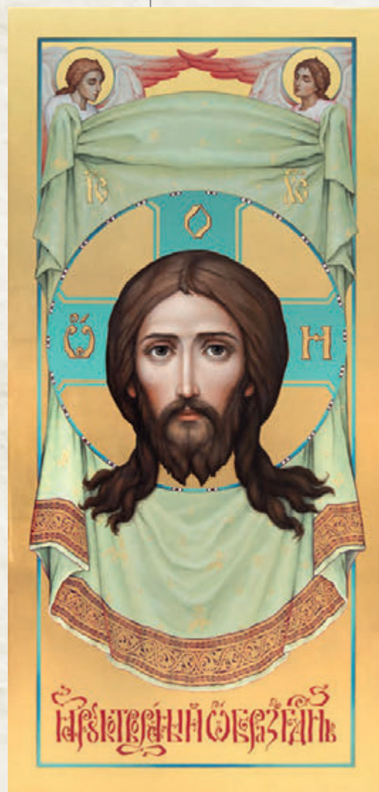
ИКОНА «НЕРУКОТВОРНЫЙ ОБРАЗ СПАСИТЕЛЯ». 138x84 см

Среди них сложно выделить наиболее значимые, но все же по выразительности образов, глубине раскрытия идейного замысла акцентируем такие, как «Спас на троне», со столь характерным жестом Христа, восходящим к иконографии XVI века, к сказанию, известному в Новгороде Великом «О чудесном видении Спасова образа Мануилу, царю греческому»;