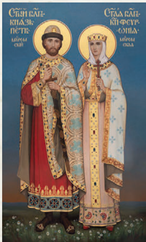
ИКОНА «СВЯТОЙ БЛАГОВЕРНЫЙ КНЯЗЬ ПЕТР И СВЯТАЯ БЛАГОВЕРНАЯ КНЯГИНЯ ФЕВРОНИЯ». 230x140 см