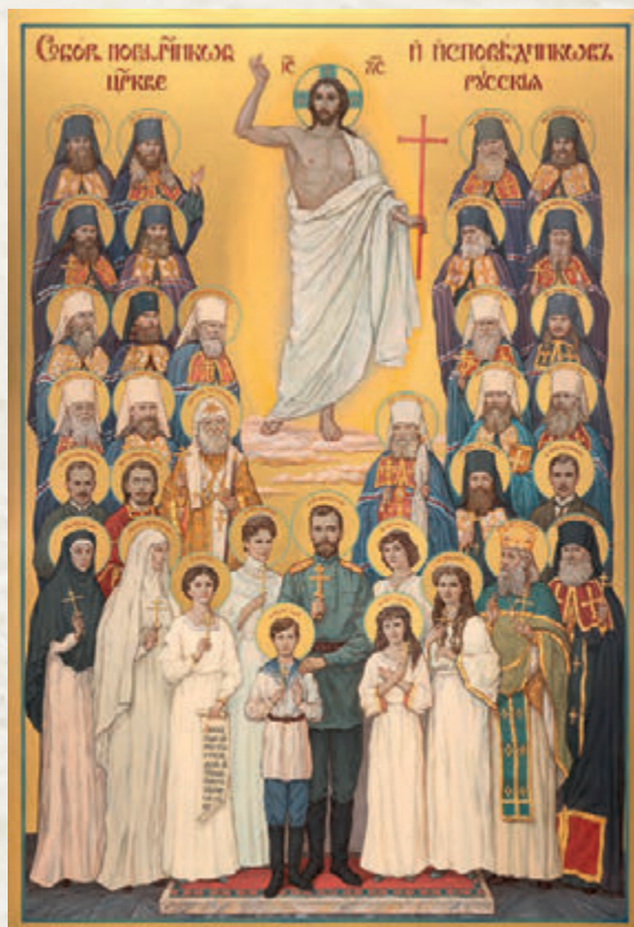
ИКОНА «СОБОР НОВОМУЧЕНИКОВ И ИСПОВЕДНИКОВ ЦЕРКВИ РУССКОЙ». 200x130 см.