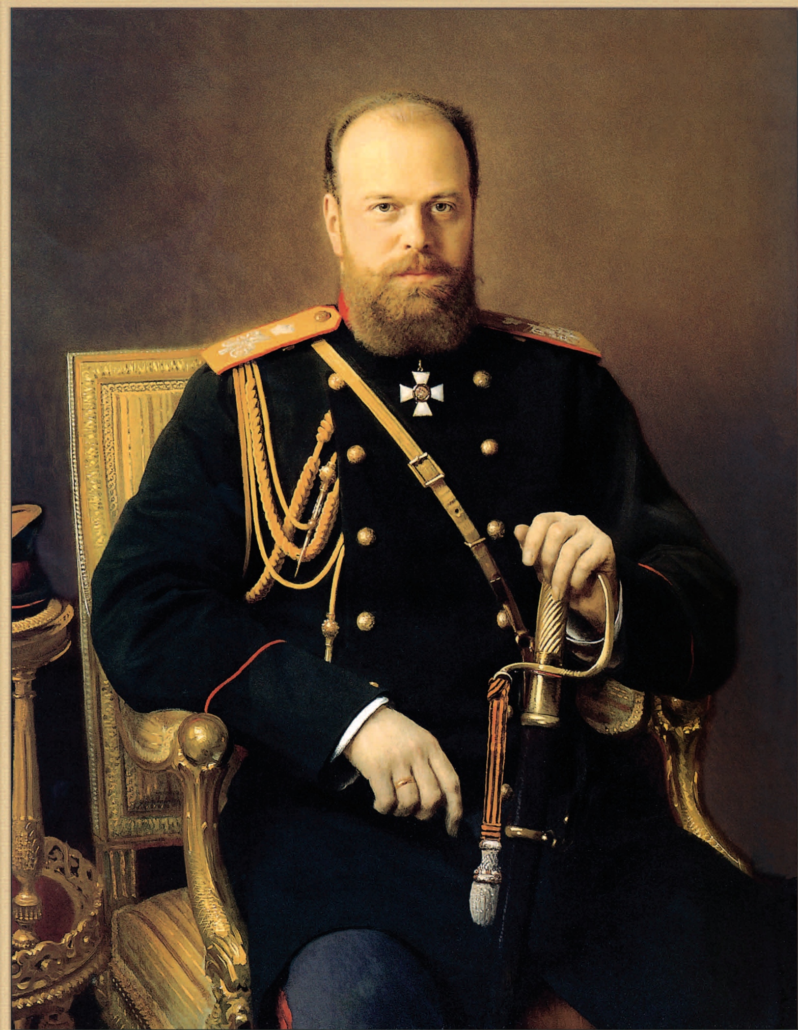
Император Александр III – миротворец