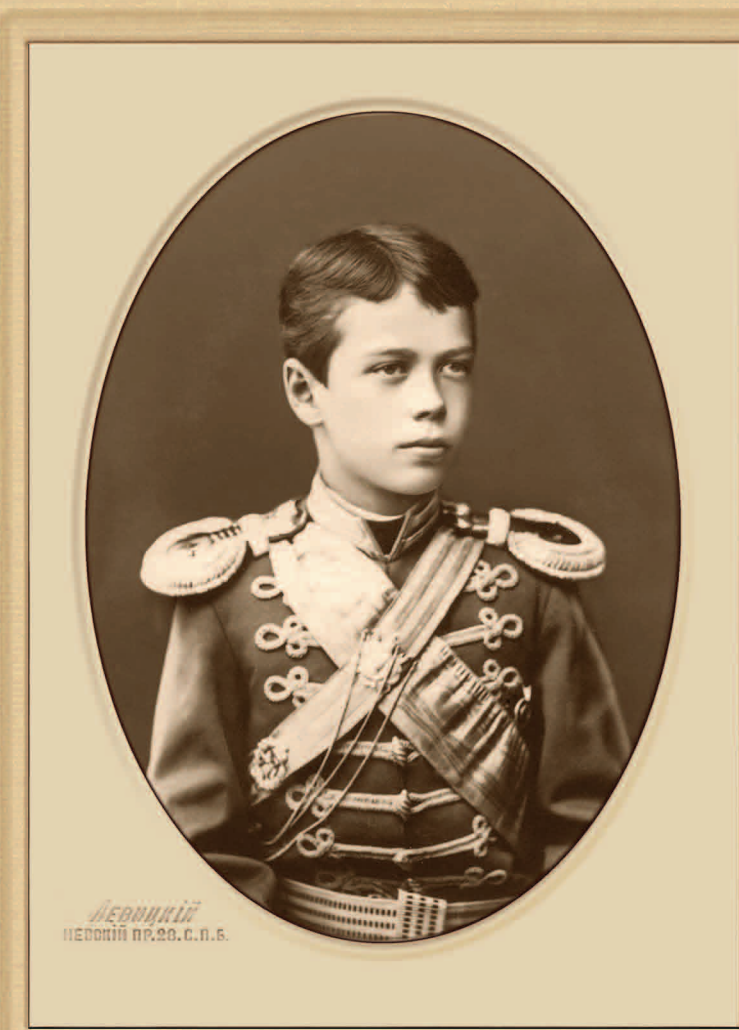
Цесаревич Николай Александрович в тринадцать лет