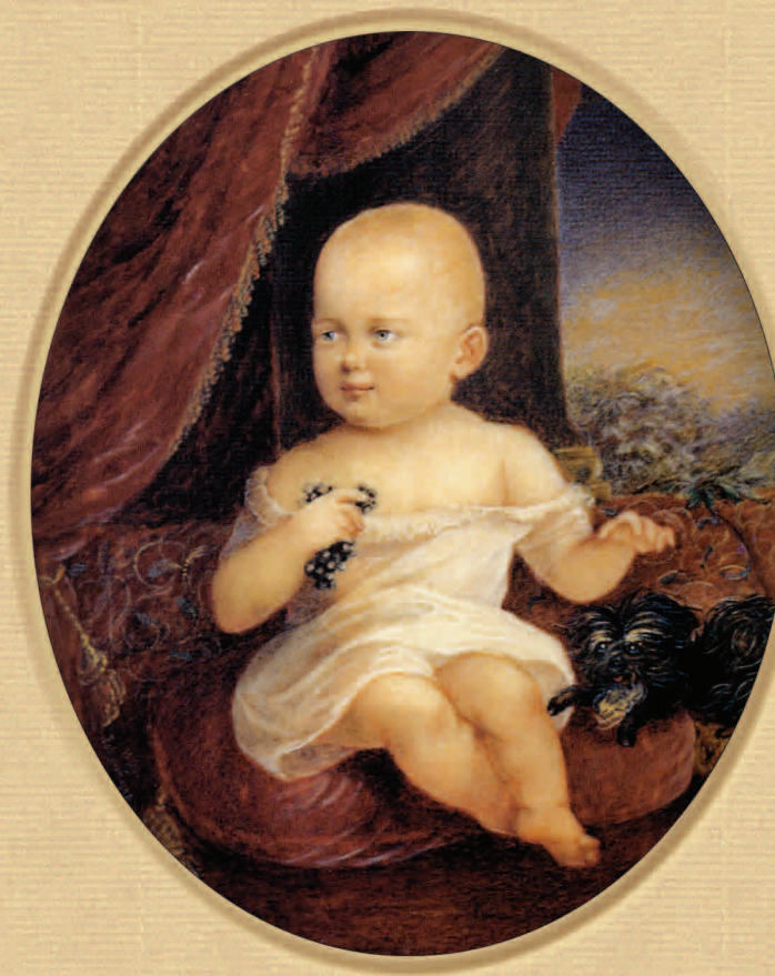
Николай Александрович в возрасте одного года