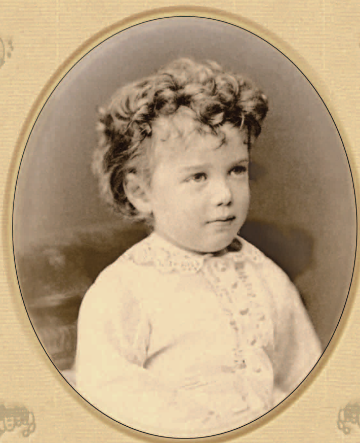
Николай Александрович в трехлетнем возрасте