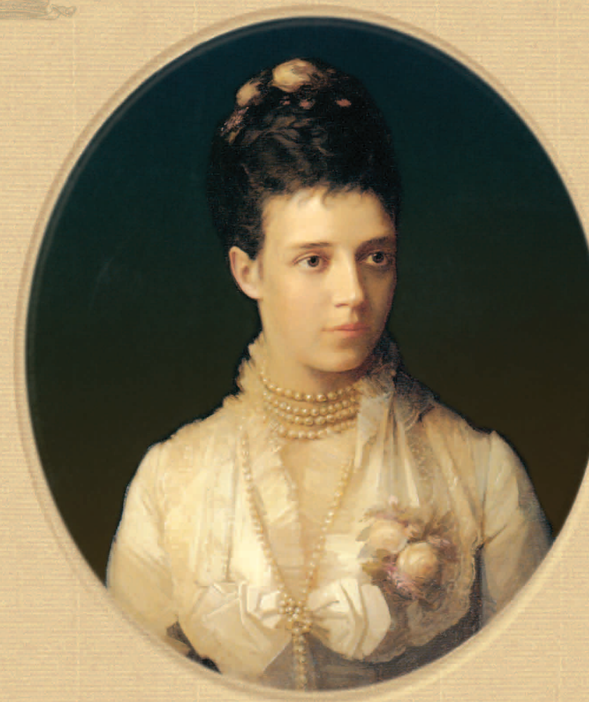
Цесаревна Мария Феодоровна