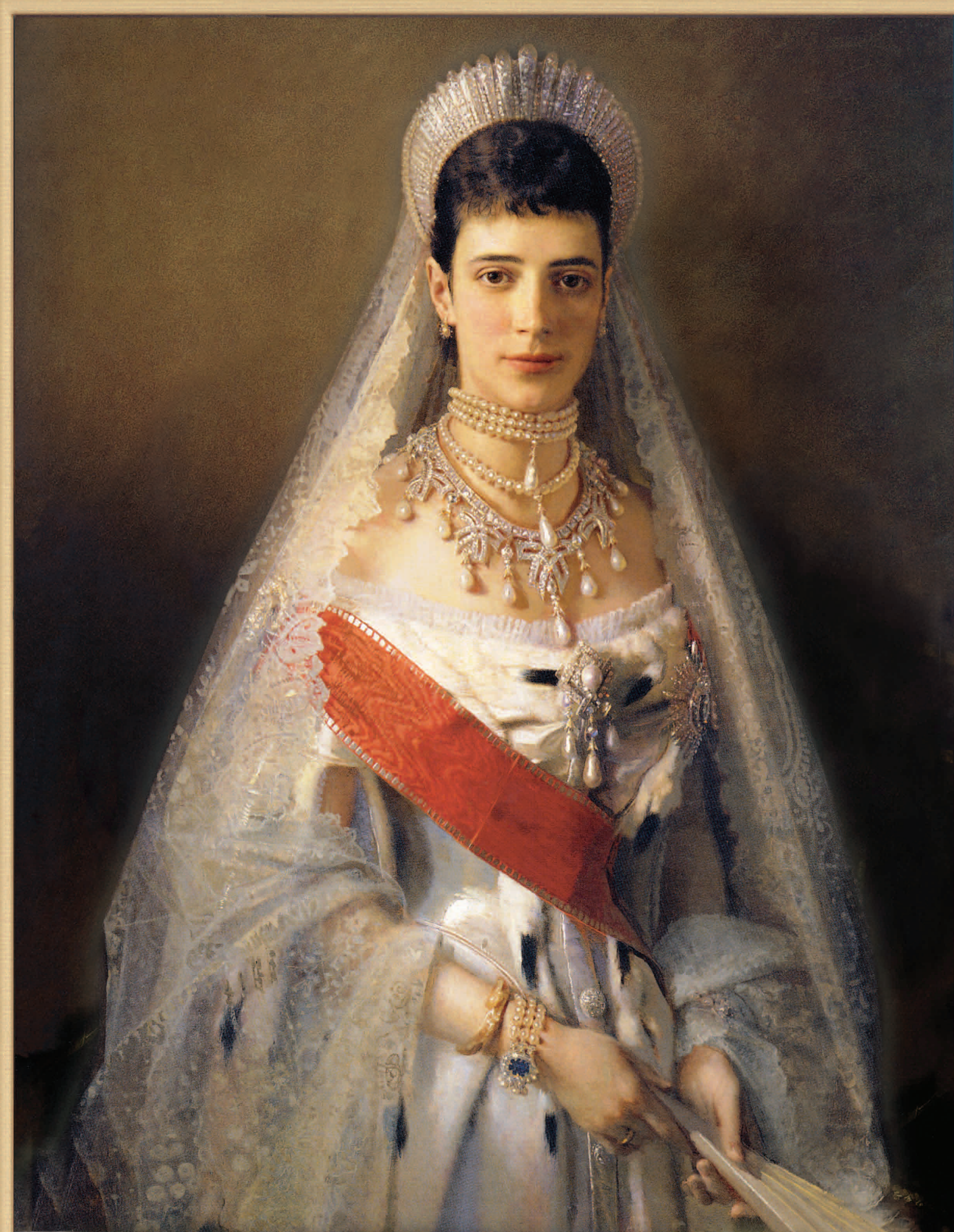
Императрица Мария Феодоровна