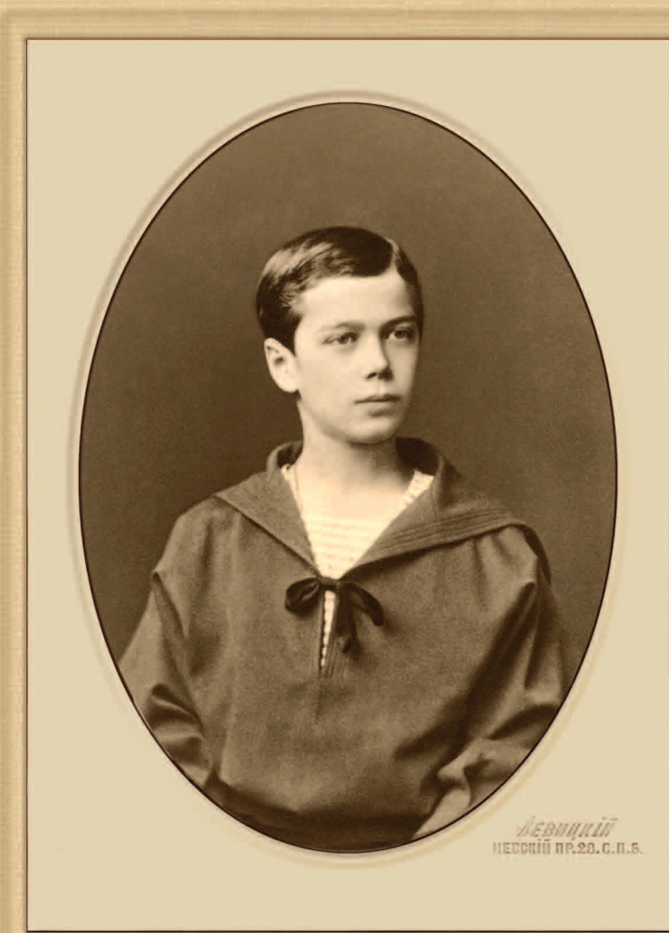
Цесаревич в свои шестнадцать лет