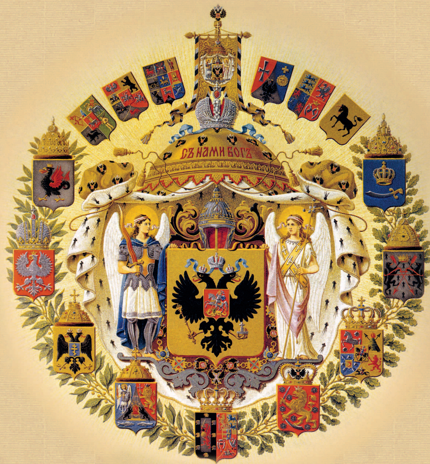
Большой ( полный ) герб Российской империи. 1882

После великой смуты в 1613 году русский народ избрал юного Михаила Феодоровича Романова своим царем.