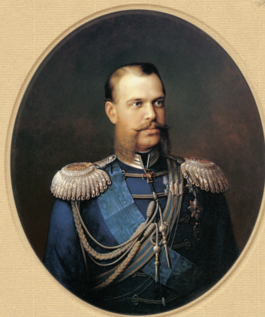
Цесаревич Александр Александрович