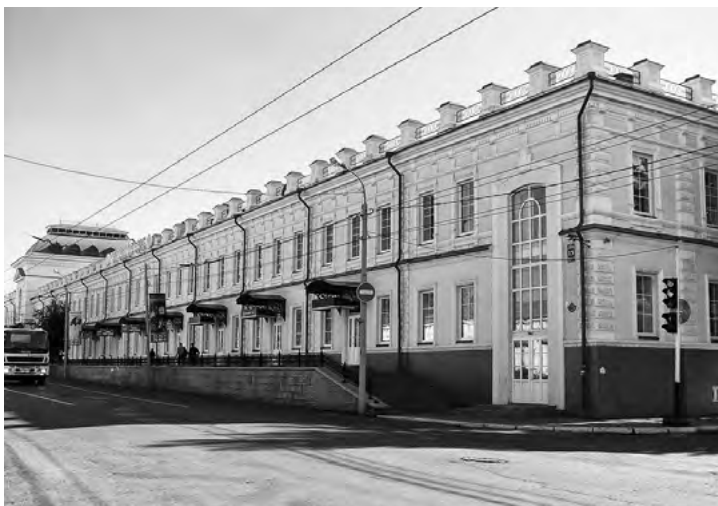
Здание, в котором располагалось медресе «Хусаиния». Оренбург. Современное фото

образом — пищевая и переработка сельхозпродукции (между прочим, здесь в 1881 году открылся первый в России завод по изготовлению сгущенного молока); население города достигло 100 тысяч.