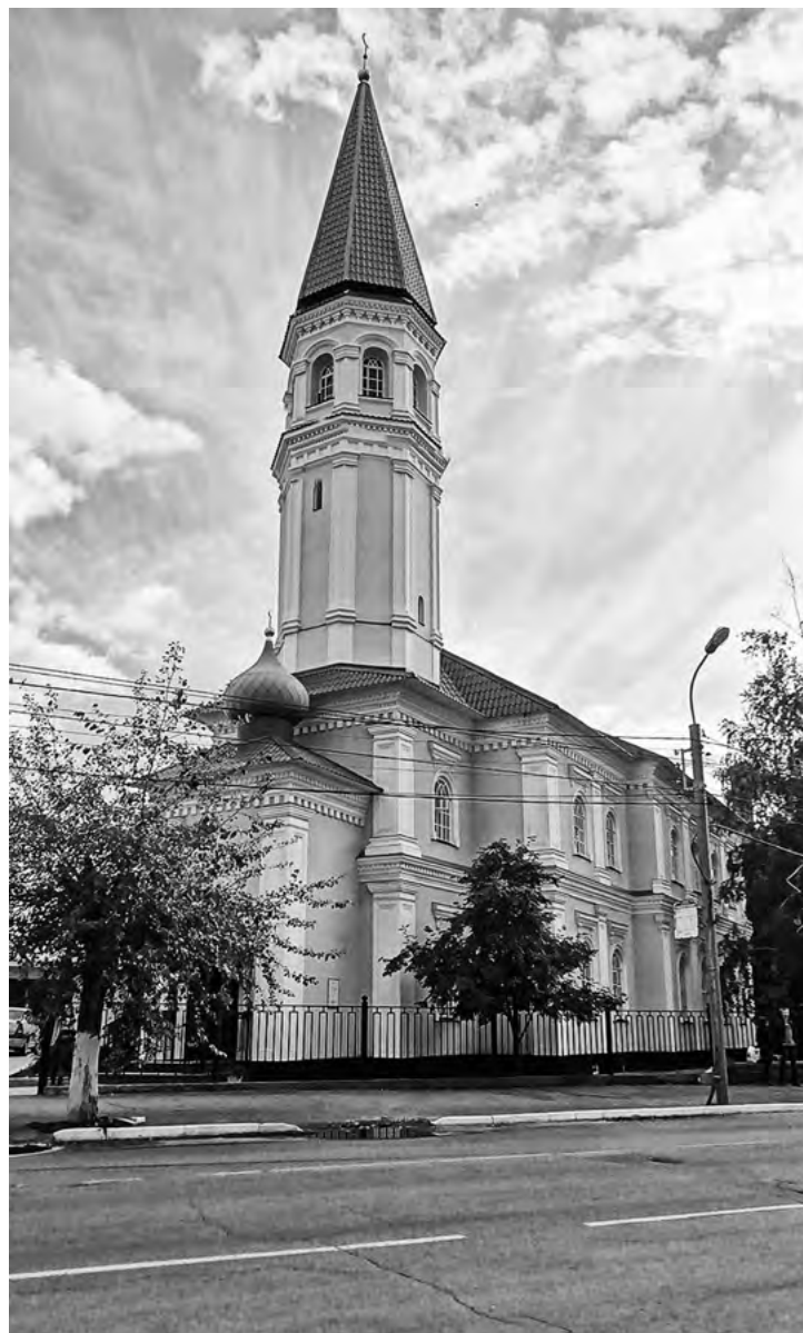
Мечеть Хусаиния в Оренбурге

Назовем еще одного человека, оказавшего несомненное влияние на Мусу Залилова, — это Закир Садыкович Рамиев, член попечительского совета медресе «Хусаиния». Он был воплощением доброты. В этом удивительном человеке сочетались успешный предприниматель-золотопромышленник и тонкий лирический поэт, депутат I Государственной думы от Оренбургской губернии (1906) и щедрый меценат. Закир вместе со старшим братом издавали книги, журналы и газеты на татарском и башкирском языках, содержали десятки образовательных школ... «Показывая яркий пример социальной