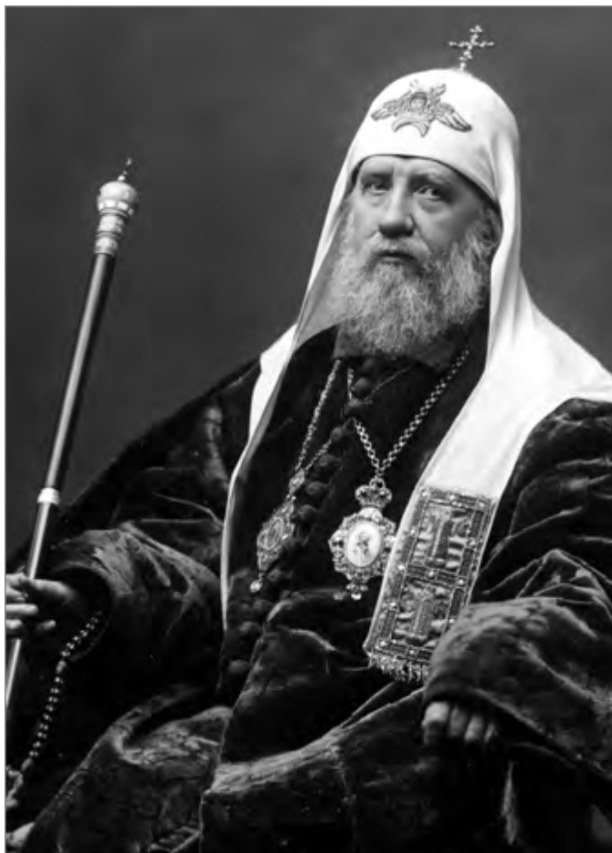
Святитель Тихон, Патриарх Московский и всея России