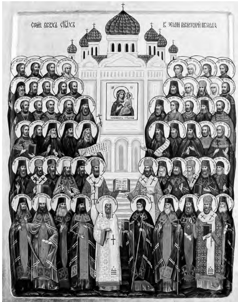
Собор Воронежских святых

Русская Православная Церковь благоговейно хранит память о подвиге архиереев, священнослужителей, монашествующих и мирян, жизнью своей засвидетельствовавших в великом терпении, в бедствиях, в нуждах, в тесных обстоятельствах, под ударами, в темницах, в изгнаниях (2 Кор. 6: 4–5) веру и любовь к Богу и ближним.