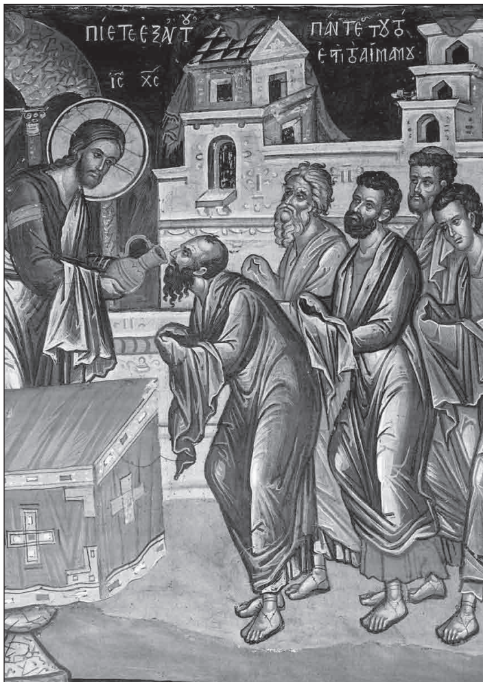
Икона «Причащение апостолов»