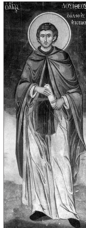
Преподобный Досифей Палестинский

Каков был блаженный Дорофей, к цели иноческого жития по Богу наставляемый и, согласно намерению, и житие восприявший, я вспоминаю умом своим. В отношении к духовным отцам своим он имел крайнее отречение от вещей и искреннее повиновение по Богу, частое исповедание, точное и неизменное хранение совести и, в особенности, несравненное послушание в разуме, будучи