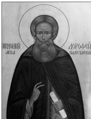
Преподобный авва Дорофей